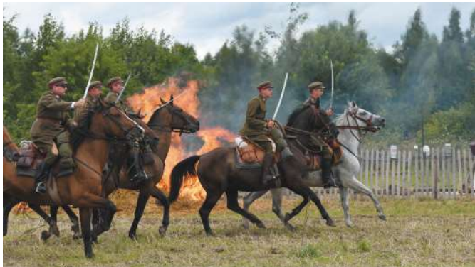
Artyleria konna, taczanki i efekty pirotechniczne - rekonstrukcja epizodu z wojny polsko-bolszewickiej 1920 roku, Prażmów, (8.10)