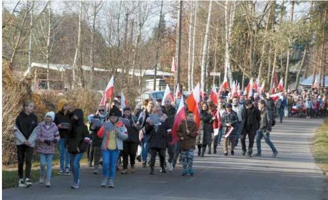
Narodowe Święto Niepodległości - po raz dwunasty odbył się marsz w Krępie (11.11)

Z góry przepraszamy organizatorów i uczestników wydarzeń, których nie ma w naszym przeglądzie. A było wiele ciekawych imprez, spotkań, akcji. Gdybyśmy chcieli je dokładniej pokazać – biuletyn musiałby mieć chyba ze sto stron... Z konieczności prezentujemy tylko wybór zdjęć.