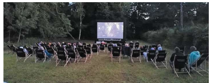
Dla widzów o mocnych nerwach - pełen czarnego humoru kryminał „Na noże”. Seans kina plenerowego, Prażmów (7.10)