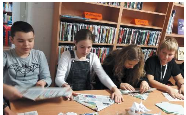
Warsztaty „Dzień z origami”