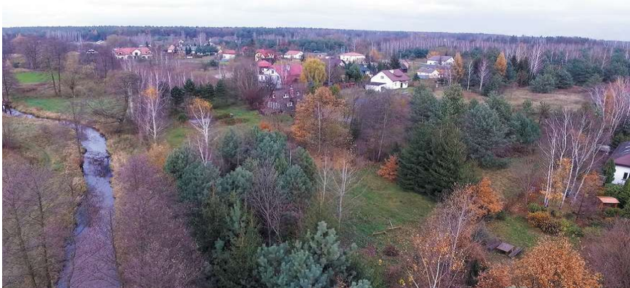
To już zdjęcie pamiątkowe - część Krępy, widok z roku 2017

Budowa osiedla Chojnów Park zaniepokoiła nie tylko mieszkańców Krępy, ale także innych miejscowości naszej gminy. W bezpośredniej bliskości otuliny Chojnowskiego Parku Krajobrazowego, na dwustu hektarach powstaje wydzielone osiedle, które ma liczyć 460 lokali. Oznacza to półtora tysiąca nowych mieszkańców – zakładając, że w każdym zamieszkają trzyosobowe rodziny.