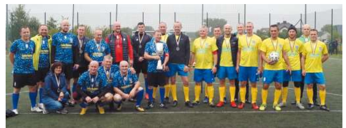
Po meczu o Puchar Ryxa - Samorządowcy kontra Lokalni Przedsiębiorcy. Samorządowcy zwyciężyli 8:6. Prażmów (21.09)