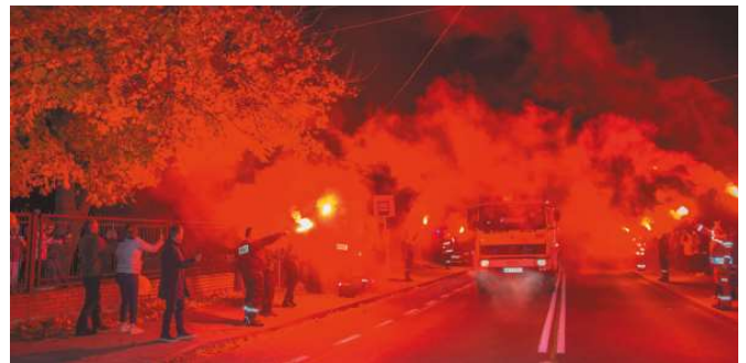
Obawy o wzniesienie pożaru nie było - feta z okazji przekazania nowego wozu bojowego dla OSP Wola Prażmowska (15.10)