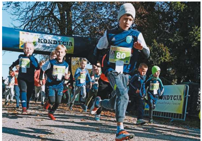
Kolejna edycja Biegu Św. Franciszka, bieg chłopców na 500 metrów, Prażmów (10.10)